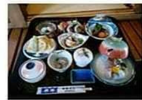
会席料理 (3300円) より 写真は3850円です。