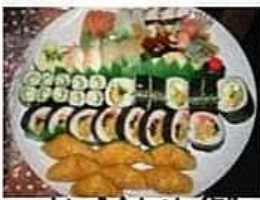
すし盛合わせ (例) 写真は5000円盛です。

刺身盛合わせ 一四五〇円より げそ唐揚げ 一人前八三〇円 天婦羅 一人前一一〇〇円 アラ煮 一人前一一〇〇円 茶碗蒸し (大) 六五〇円 (小) 五一一〇円 酢物 一人前八二〇円 赤だし 四六〇円 吸物 四六〇円